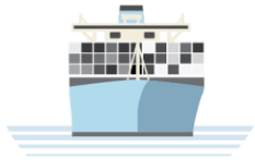
A.P. MØLLER - MÆRSK