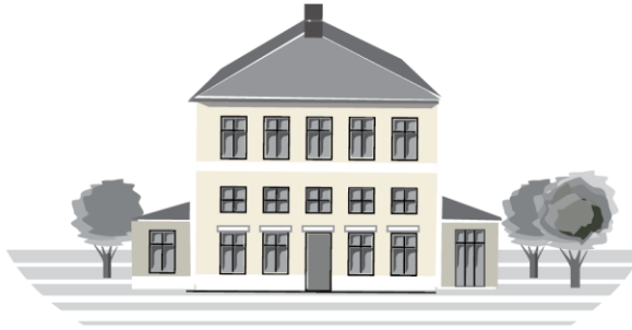
A.P. MØLLER FONDEN