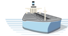
MAERSK PRODUCT TANKERS