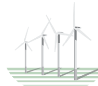
KK WIND SOLUTIONS